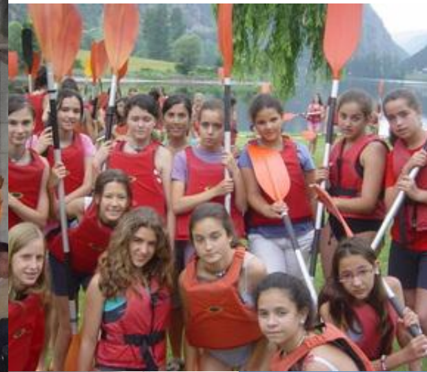
Excursión en piraguas