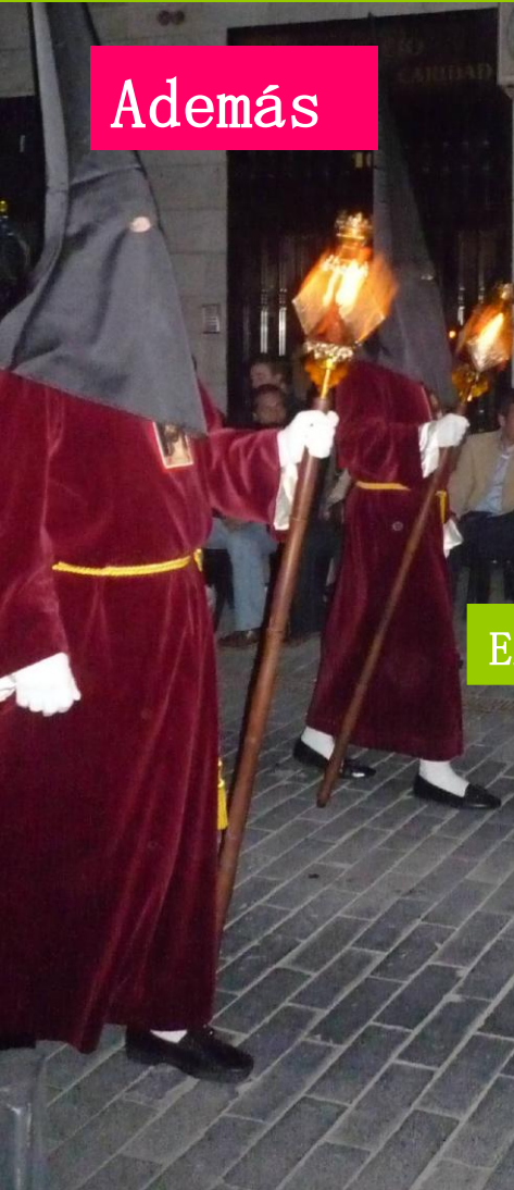
Procesiones en Cartagena