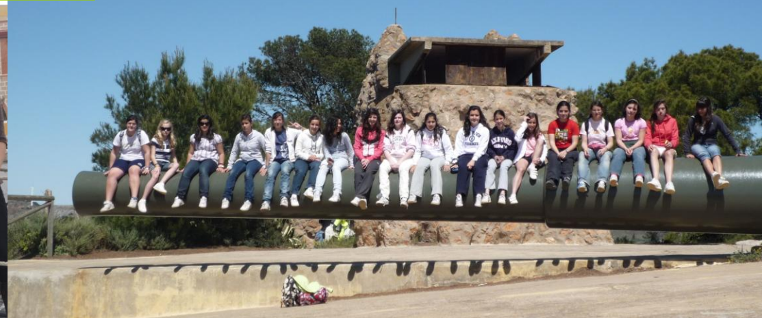
Senderismo y excursiones