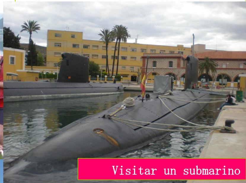
Visitar un submarino